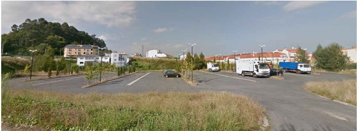
Imaxe 3. Área de aparcadoiro e servizos da área deportiva de A Galea (Concello de Miño)

Os circuítos discorren case na súa totalidade por camiños e sendas naturais do concello de Miño, con saída e chegada na área deportiva de A Galea.