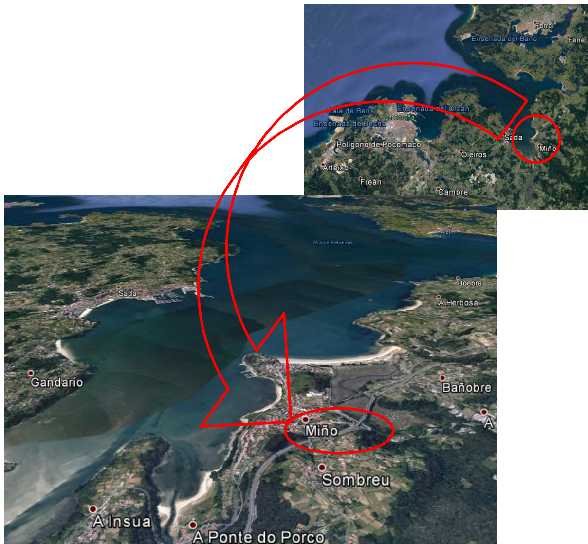
Imaxe 1. Situación do concello de Miño (Ría de Betanzos)

A proba, para todas as distancias, realizarase integramente no municipio de Miño, con saída e chegada na área deportiva de "A Galea".